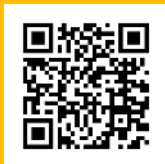
Youtube Herbstferienspiele 2022

Die Herbstferienspiele wurden durch ein 3-köpfiges Leitungsteam angeleitet.